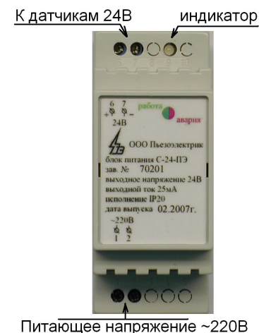
Рисунок 2 – расположение разъемов ИП.

Расположение разъемов для подключения к ИП показано на рисунке 2.