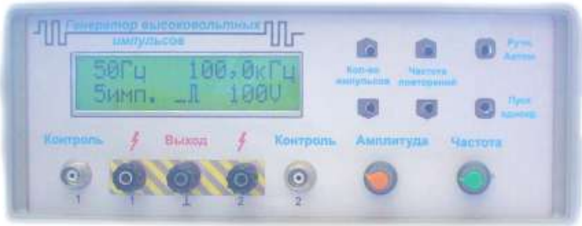
Рисунок 2 – Внешний вид передней панели